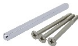
PVC-10 (стержень 114 mm + 3 винты 70mm) PVC-11 (стержень 124 mm + 3 винты 80mm)