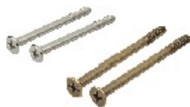
PVC-13 (2 винты 70mm) PVC-14 (2 винты 80mm)