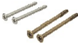
PVC-13 (2 wkręty 70mm) PVC-14 (2 wkręty 80mm)